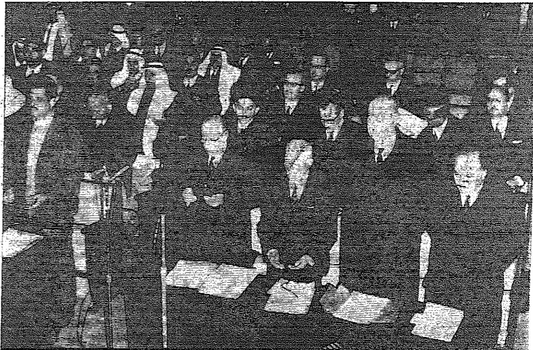
الوزراء والنواب يقفون حدادا على الشهداء

عمان - ألقى دولة السيد بهجت التلموني رئيس الوزراء بياناً سياسياً هاماً ، في الجلسة التي عقدها مجلس النواب صباح امس . وفيما يلي نص البيان : «بسم الله الرحمن الرحيم» دورة غنية بالاجازات والتهنئة ، مؤكداً لكم استعداد الحكومة الكيد ، ورغبتها الحارة في التعاون الصادق مع السلطة التشريعية المؤثرة في كل ما يعود على بلدا الغالي وشعبنا الابي وتفتينا القناعة باقبح والخير . البقية على صفحة ٢ ع ٢